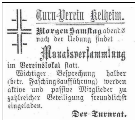
Abb. 1: Zeitungsartikel zur Bekanntmachung der Monatsversammlung des Turnvereins Kelheim am 13. Januar 1911 [ABK01]

Die benötigten Mittel wurden in einer Sammlung im Stadtgebiet Kelheim und durch großzügige Spenden mehrerer Gönner beschafft. Der „Magistrat der Stadt Kelheim“ bewilligte eine einmalige Unterstützung aus der Kommunkasse. Die Einnahmen und Ausgaben im Zusammenhang mit dem Schäfflertanz wurden von Kassier Ignaz Ziegler in einem „Tagebuch für besondere Aufführungen“ nachgewiesen.